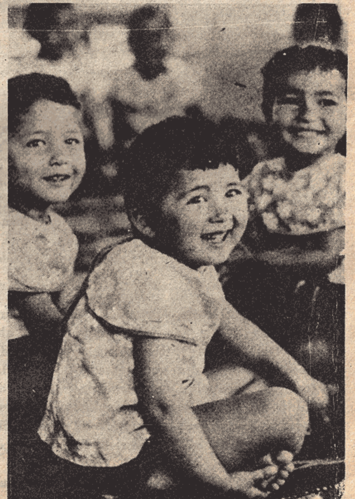
Çiftliğin anaokulunda çocuklar...