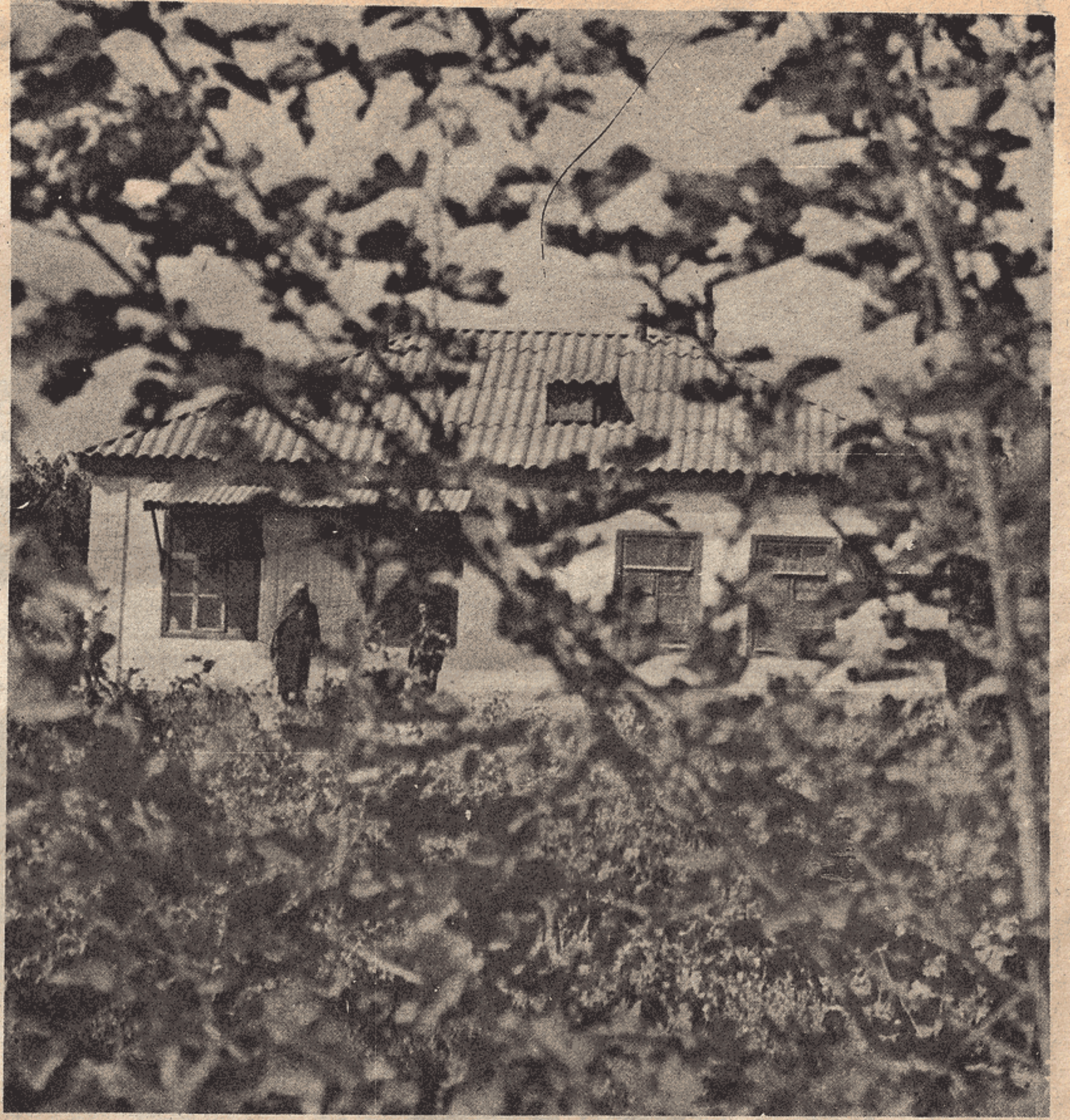
Sosyalizm Çiftliğinde bir köylü evi...

Nari, eğlence ve kültür işlerinde çiftlik yöneticisinin temsilcisidir.