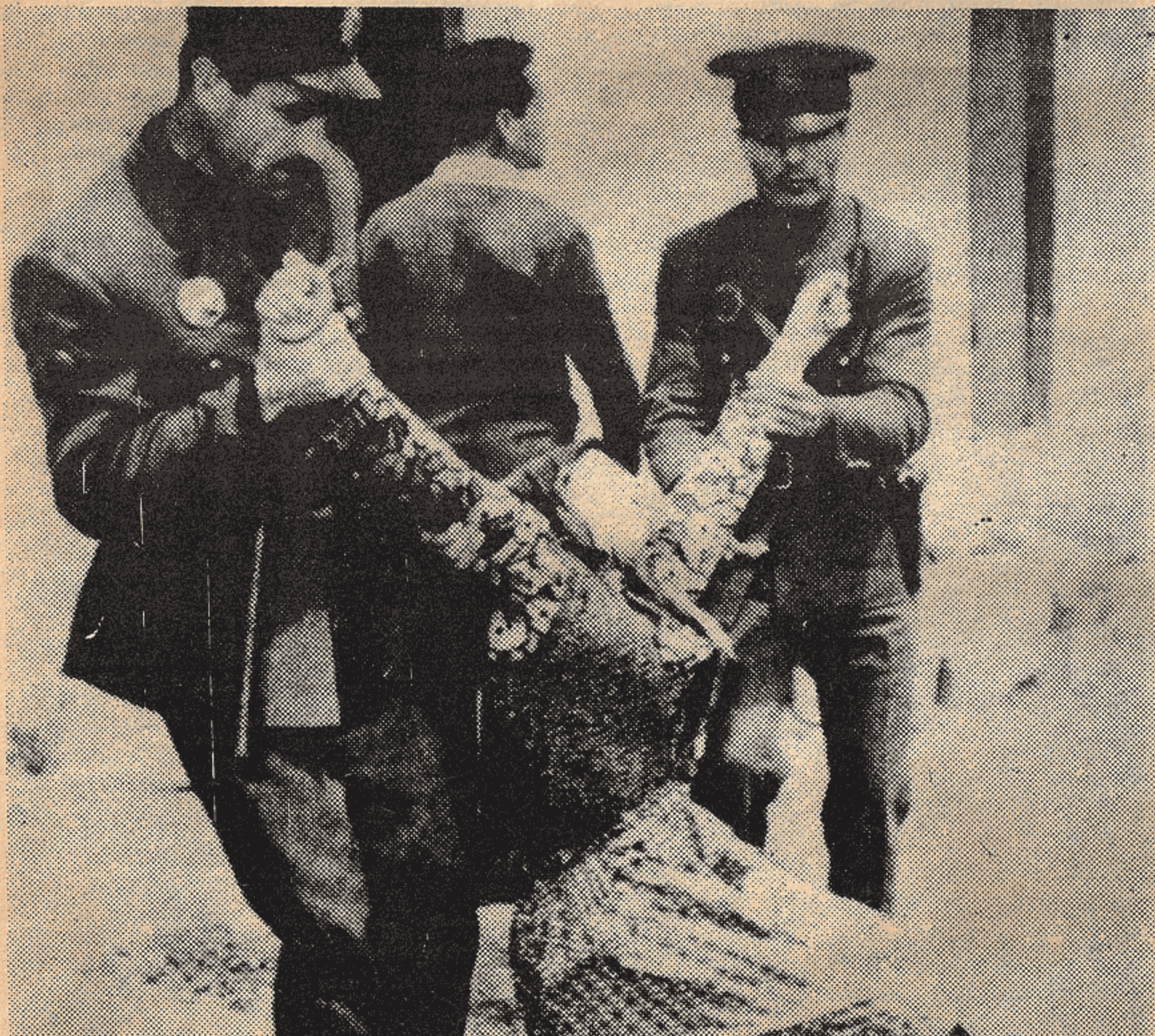
Kürdistan'da bir gösteriden sonra durum...

Iro welatê Kurdan nav sê-çar dewletan da perva bûye, Kurdistan buye kolonîya wan, şunda ma ye; gelê Kurd xîzan û nezan bûye. Faşîzm hebe û nebe jî heya ku burjuvazîya kolonyalîst li wan welatan li ser hukîm e, heya ku li van welatan sazûmanên demokratîk çê nebe û gelê Kurd jî rîzgar nebe, doza xîlasbûna gelê Kurd naqede. Lê dîsa jî çawa gelê Kurd bo rîzgariya xwe humber kolonyalîzmê şer dîke, hewce ye, her usa jî humber faşîzmê jî şer bîke. Bona ku faşîzm jî sazûmana kolonyalîstan e, sazûmana burjuvazîya ya herî paşverû, xwini û nijadperest e.