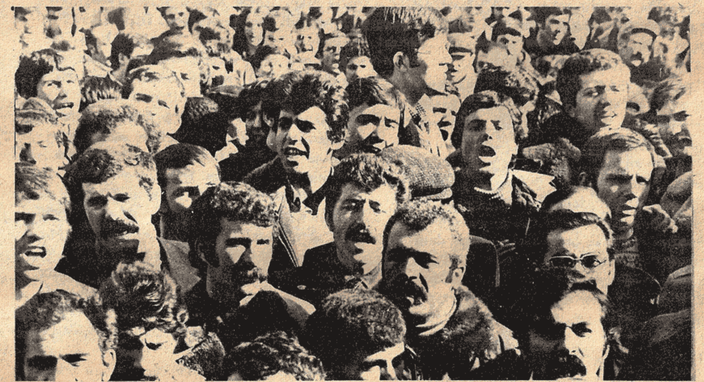
DEK'ten bir görünüş

Yıllar boyu Kürt halkının varlığını inkar eden, onu eritmeye çalışan ve eğitim emekçilerini de bu amaçla kullanmak isteyen burjuvazi için bu büyük bir samar oldu. Bir yandan işçi sınıfının, diğer yandan Kürt halkının ulusal demokratik mücadelesinin vardığı