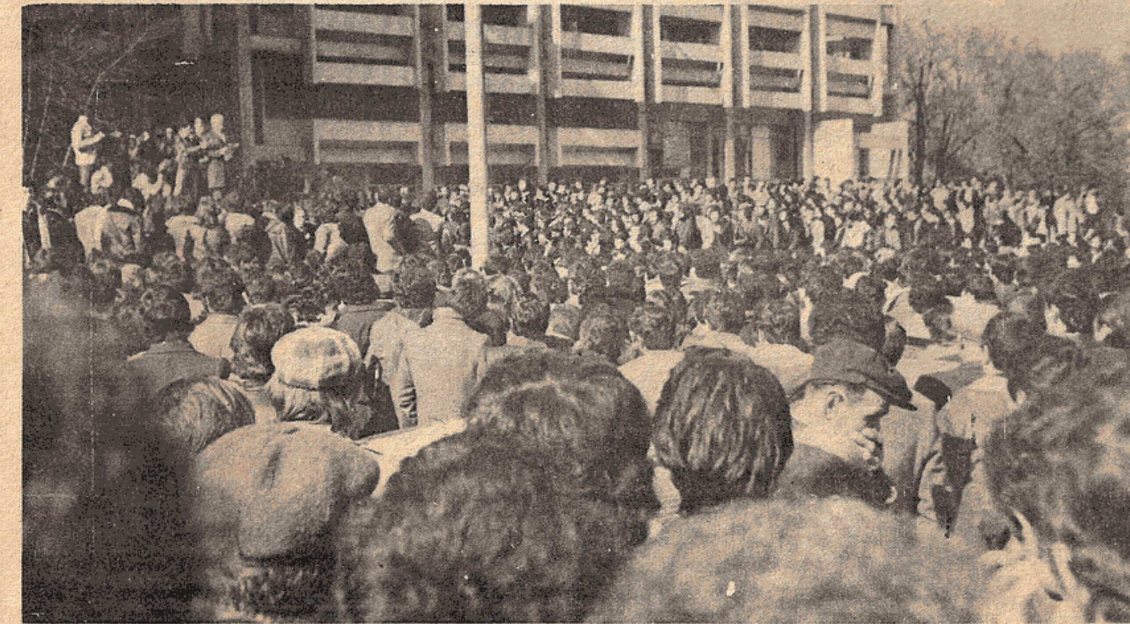
DEK delegelerinin Eğitim Enstitülerine ilgili protesto gösterisi

Devrimci Eğitim Kurultayı'nda, genel olarak ilerici, demokrat, devrimci basın, özel olarak da gazetemiz üzerindeki ağır baskıları oybirliğiyle protesto edildi. Buna ilişkin kararı aşağıda sunuyoruz. Bu karar, Kürt ve Türk emekçileri, aydınları arasında dayanış-