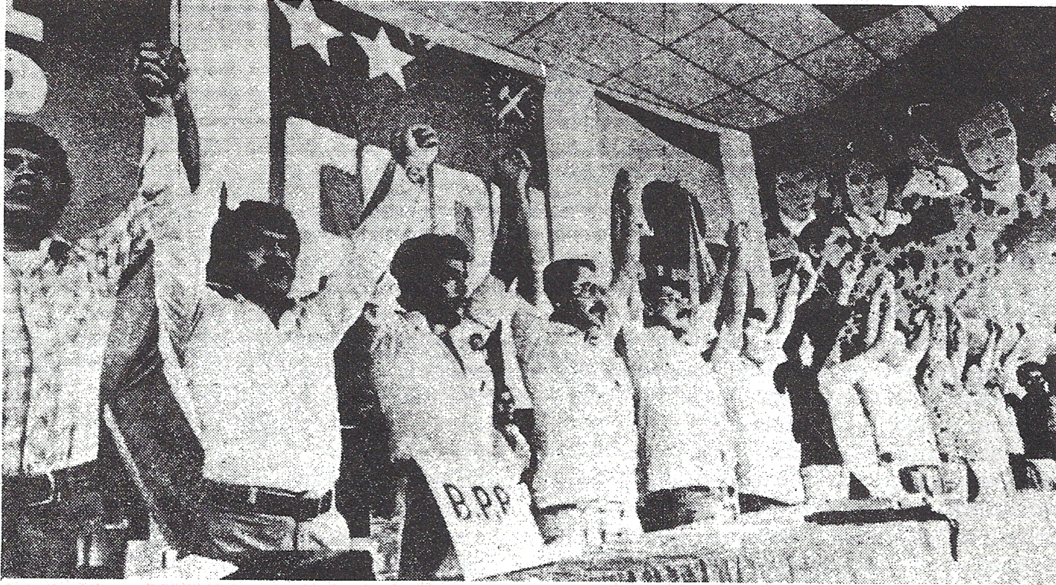
Demeke dirokî : Bi avabûna Enîya Şoreşger a Gelêrî, nabera rêxistinên şoreşger de yekîtiya xebatê çêbû.

Li welatê Amerîka Navîn El Salvadorê naha şerekî hundur destpêkirîye. Li alîkî cûntake leşkerî, ya ku bi her awayî piştî xwe daye emperyalîzma Amerîka, li aliyê din jî hêzên gelêrî yê demokratîk hene û şer dikin. Cûnta leşkerî bi hemû hêza xwe dajo ser hêzên şoreşger. Lê ew êriş û zordestiya cûnta leşkerî hêzên welatparêz nêzî hev dike.