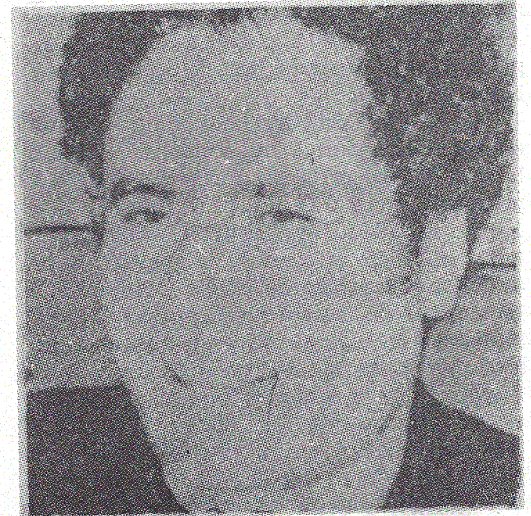
Serdar Müemmer Qaddafi

Ji bo van dazan û daxwazên Serdar Müemmer-Qaddafi yê mirovperwer û alîkarê milletên bîndest û perçekirî, em hemî kurdên welatperwer û şorişger çî